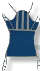
IMBRACATURA AD U CON TESTIERA PER BI-AMPUTATI