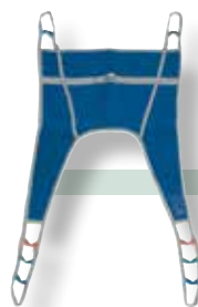
IMBRACATURA AD U SENZA TESTIERA

Codici e misure imbracatura senza testiera: 819131 mis. M - 819132 mis. L Codici e misure imbracatura con testiera: 819135 mis. M - 819136 mis. L