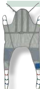
IMBRACATURA AD U A RETE CON TESTIERA