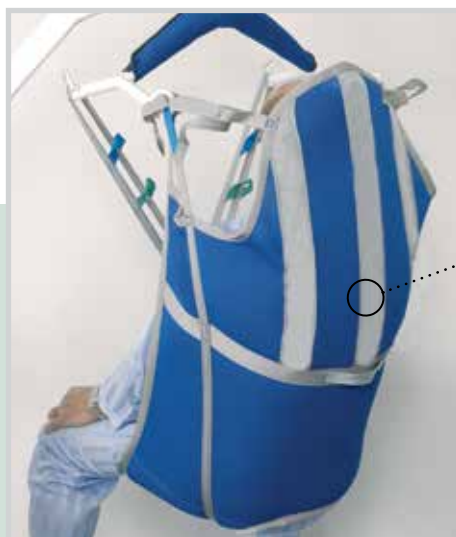
Imbracatura a U con testiera

Materiali resistenti e rifiniture rinforzate per garantire prodotti di lunga durata, pratici e curati nel dettaglio per assicurare il massimo comfort ad utente e caregiver.