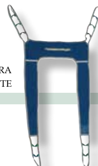
IMBRACATURA DA TOILETTE