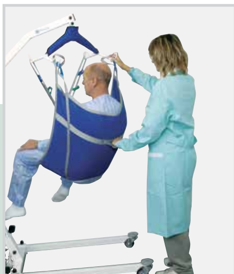
Imbracatura a U senza testiera